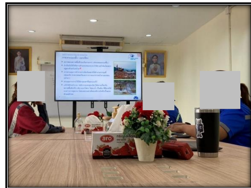
รูปที่ 2-47 อบรมพนักงานในเรื่องอาชีวอนามัย พร้อมทั้งแนะนำถึงวิธีการใช้เครื่องจักรและอุปกรณ์ต่าง ๆ