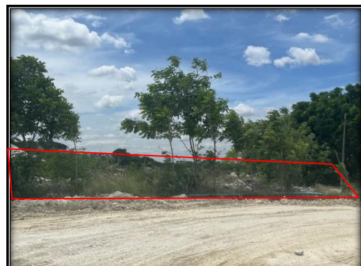
รูปที่ 2-42 คั่นดินสูงประมาณ 2 เมตร รอบบ่อดักตะกอน