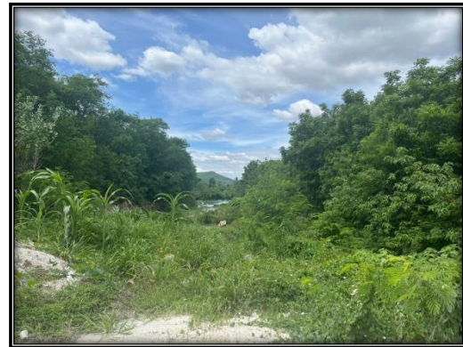
รูปที่ 2-7 ปลูกต้นไม้รอบพื้นที่เวนคืนที่ดินเพื่อทำเหมืองทางทิศตะวันตกเฉียงใต้