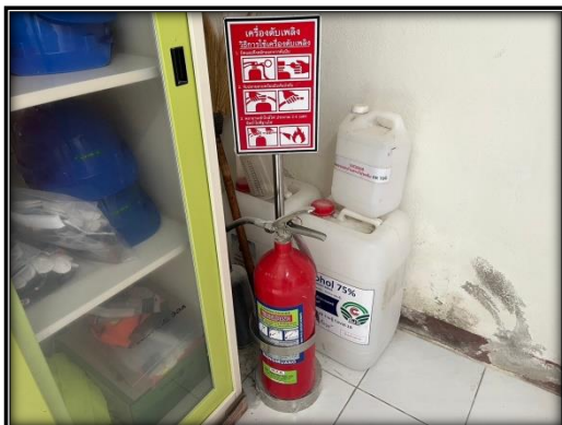
รูปที่ 2-18 ถังดับเพลิงบริเวณสำนักงาน