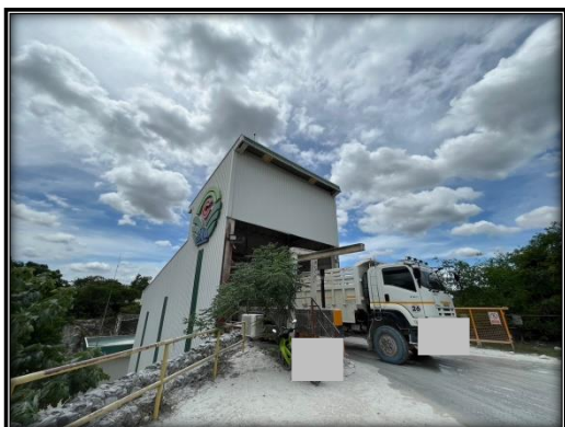
รูปที่ 2-26 โรงแต่งแร่เป็นอาคารปิด