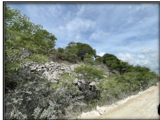
รูปที่ 2-40 กองเก็บเศษดิน