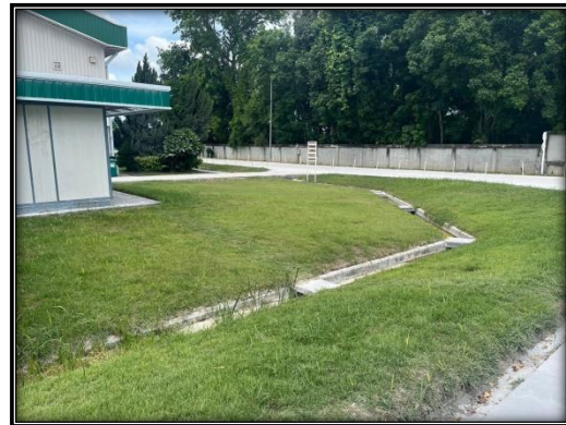
รูปที่ 2-28 แนวต้นไม้และคูระบายน้ำ บริเวณโรงแต่งแร่