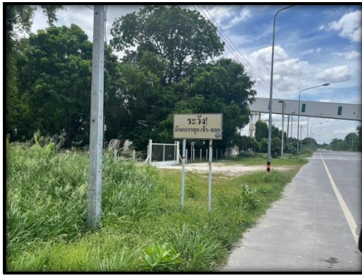
รูปที่ 2-11 ป้ายเตือนระวังรถบรรทุกเข้า-ออก