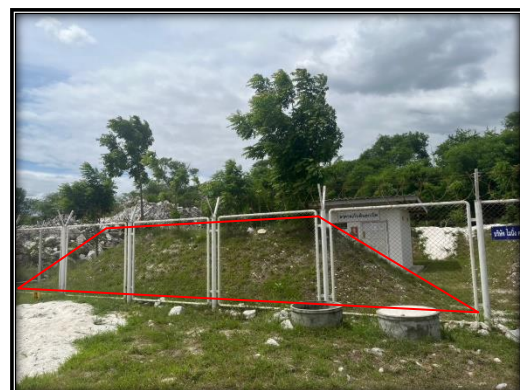
รูปที่ 2-21 คันทำนบดินรอบคลังวัตถุระเบิด