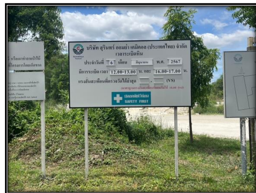
รูปที่ 2-8 ป้ายแสดงข้อมูลเกี่ยวกับโครงการ ขอบเขตพื้นที่โครงการ และขอบเขตการทำเหมือง