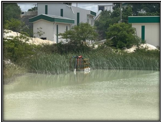
รูปที่ 2-38 บ่อรองรับน้ำ (Sump) พร้อมเครื่องสูบน้ำไปบ่อดักตะกอน