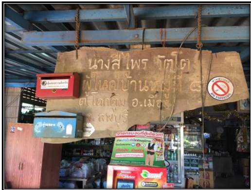
กล่องรับเรื่องร้องเรียนบริเวณหมู่ที่ 8