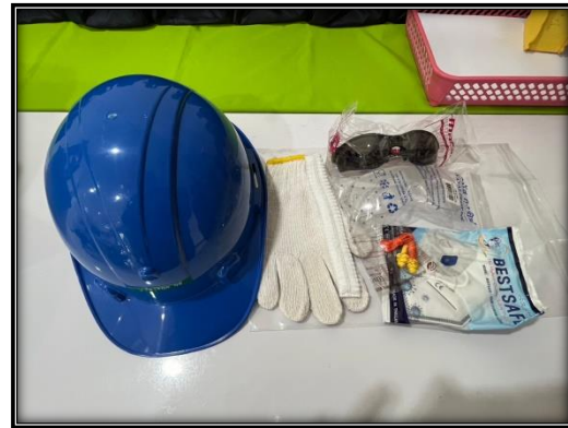
รูปที่ 2-17 อุปกรณ์ป้องกันอันตรายส่วนบุคคลให้กับพนักงาน