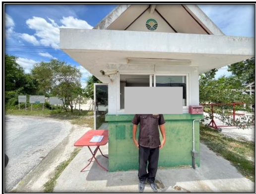
รูปที่ 2-22 เจ้าหน้าที่รักษาความปลอดภัย