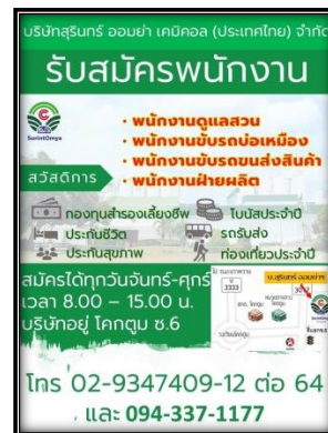
รูปที่ 2-46 ป้ายรับสมัครงาน จัดจ้างแรงงานในท้องถิ่น ติดประกาศด้านหน้าโครงการ