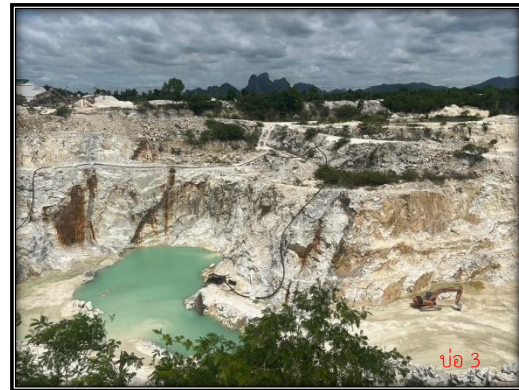
รูปที่ 2-4 พื้นที่หน้าเหมืองปัจจุบัน