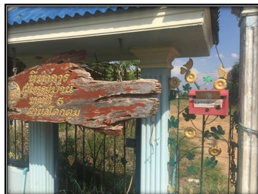
กล่องรับเรื่องร้องเรียนบริเวณหมู่ที่ 5