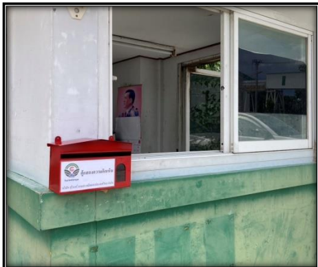
กล่องรับเรื่องร้องเรียนบริเวณสำนักงานของโครงการ