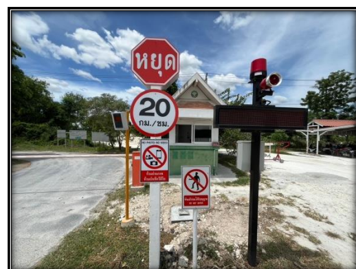
รูปที่ 2-49 ป้ายสัญลักษณ์ความปลอดภัย