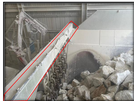
รูปที่ 2-27 ระบบสเปรย์น้ำ บริเวณโรงแต่งแร่