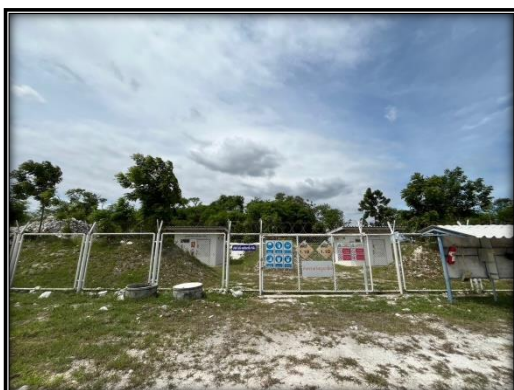
รูปที่ 2-20 คลังวัตถุระเบิด พร้อมติดป้ายเตือน “อันตรายวัตถุระเบิด”