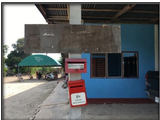
จุดรับเรื่องร้องเรียนหมู่ที่ 4