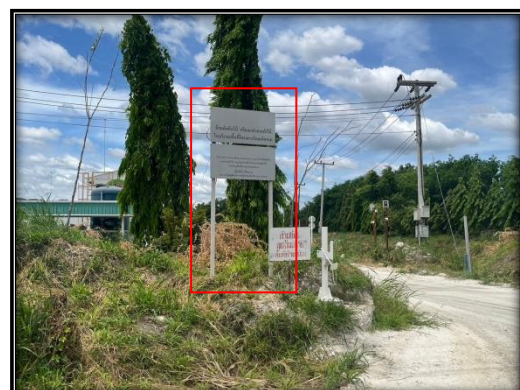
รูปที่ 2-10 ป้ายห้ามล่าสัตว์และห้ามตัดต้นไม้