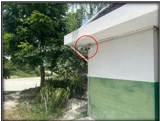
รูปที่ 2-24 กล้องวงจรปิดบริเวณทางเข้าเหมืองแร่