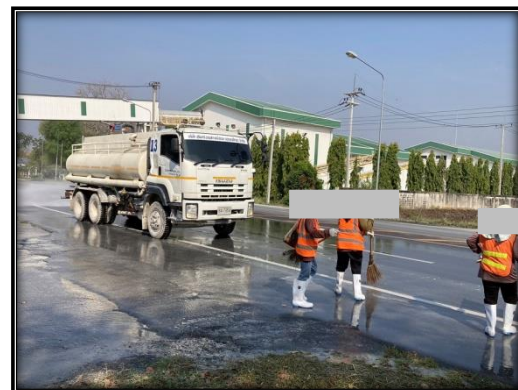
รูปที่ 2-48 ฉีดพรมน้ำบริเวณหน้าเหมือง