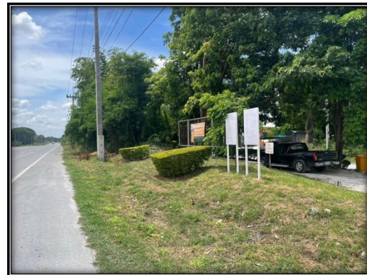
รูปที่ 2-5 ปลุกต้นไม้รอบพื้นที่เว้นการทำเหมืองทางทิศเหนือ