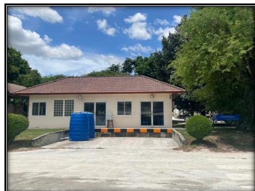
รูปที่ 2-34 โรงผลิตน้ำเพื่อชุมชน