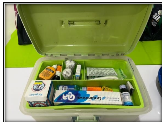
รูปที่ 2-16 เครื่องมือปฐมพยาบาล ยาสามัญประจำบ้าน เวชภัณฑ์จำเป็น