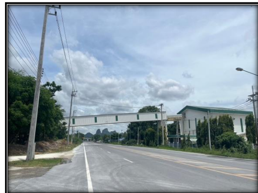
รูปที่ 2-25 โรงแต่งแร่