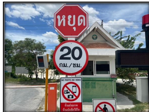
รูปที่ 2-14 ป้ายจำกัดความเร็วไม่เกิน 20 กิโลเมตร/ชั่วโมง