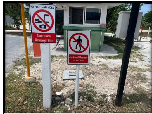
รูปที่ 2-23 ป้ายห้ามเข้าก่อนได้รับอนุญาต และห้ามถ่ายรูป บริเวณทางเข้าเหมืองแร่