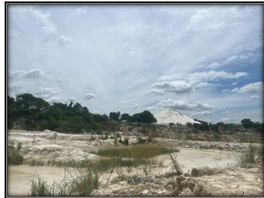
รูปที่ 2-39 บ่อดักตะกอน