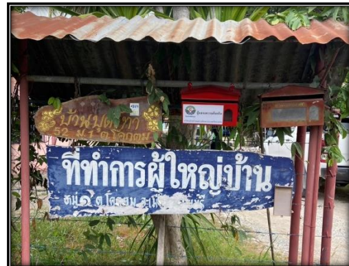
กล่องรับเรื่องร้องเรียนบริเวณหมู่ที่ 1