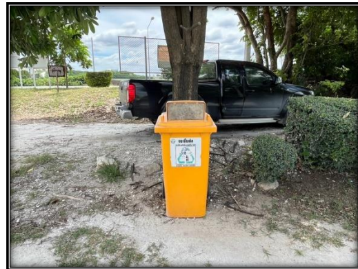
รูปที่ 2-43 ถังขยะภายในโครงการ