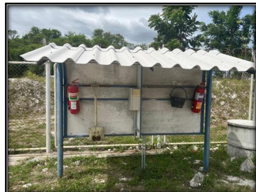
รูปที่ 2-19 ถังดับเพลิงบริเวณคลังระเบิด