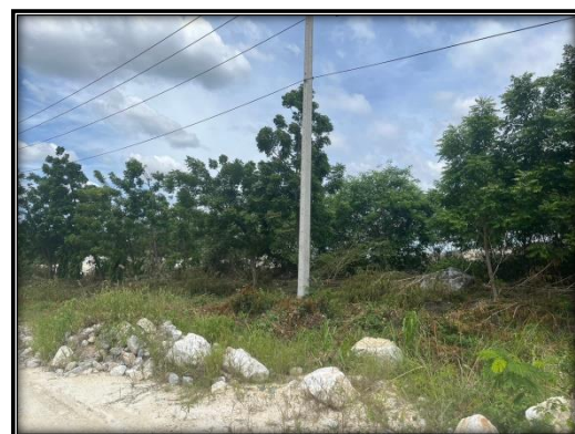
รูปที่ 2-6 ปลุกต้นไม้รอบพื้นที่เว้นการทำเหมืองทางทิศตะวันตก