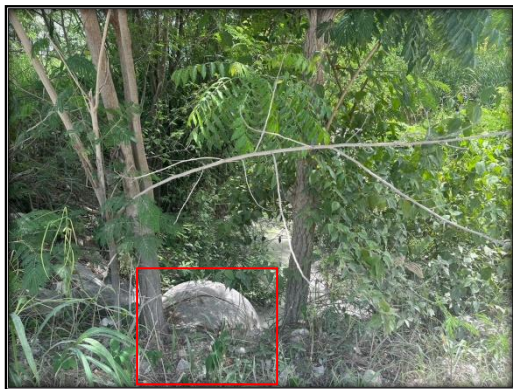
รูปที่ 2-33 ท่อลอดบริเวณประตวนบัตรที่ 29110/15382