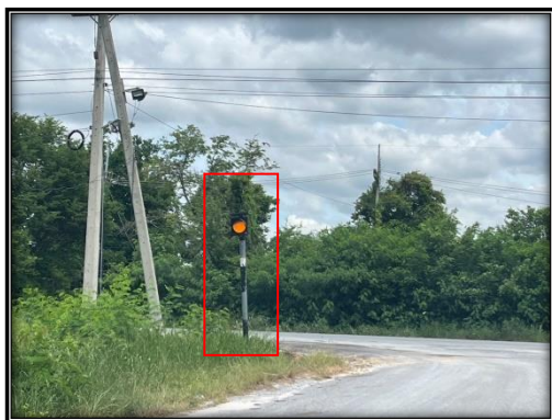
รูปที่ 2-41 สัญญาณไฟกระพริบบริเวณริมเส้นทางขนส่งแร่