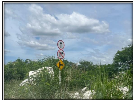
รูปที่ 2-49 ป้ายสัญลักษณ์ความปลอดภัย