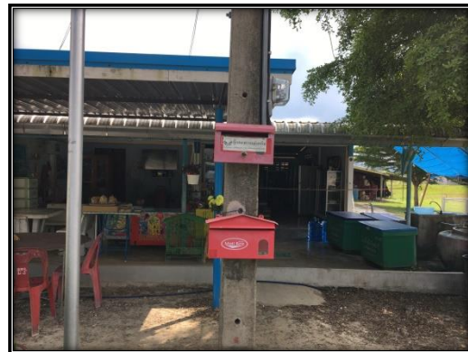
กล่องรับเรื่องร้องเรียนบริเวณหมู่ที่ 3