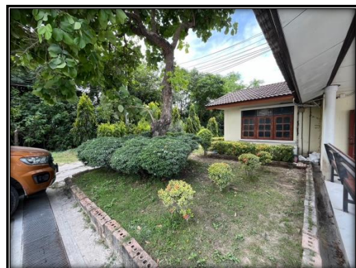
รูปที่ 2-37 ปลุกพืชคลุมดิน