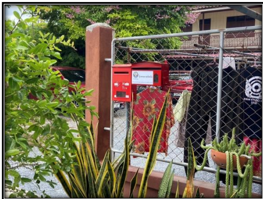
กล่องรับเรื่องร้องเรียนบริเวณหมู่ที่ 2