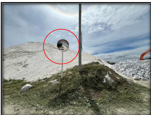
รูปที่ 2-15 กระจกโค้งบริเวณทางแยก