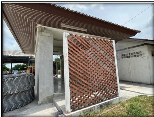
รูปที่ 2-35 ห้องน้ำพนักงาน