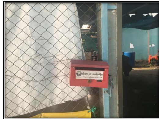
กล่องรับเรื่องร้องเรียนบริเวณหมู่ที่ 11