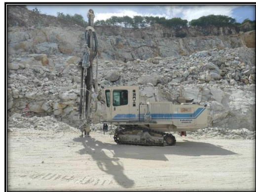
รูปที่ 2-36 เครื่องเจาะรระเบิด