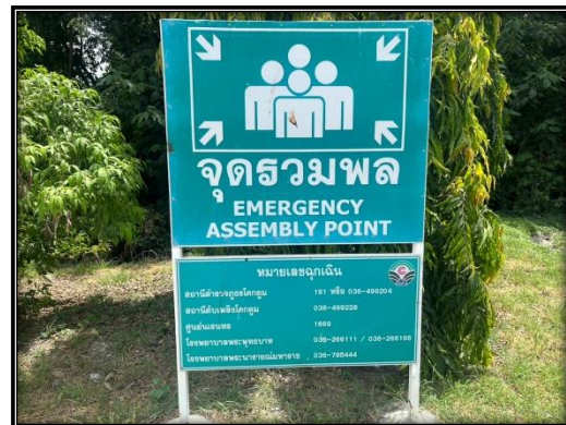
รูปที่ 2-12 จุดรวมพล